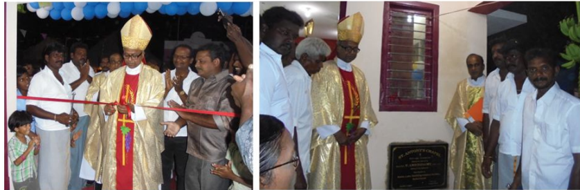
Blessing of the chapel dedicated to St Antony of Paduva : Mullai Nagar, Kumbakonam Parish