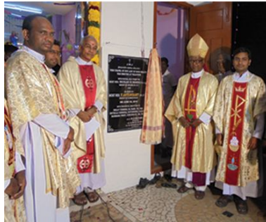
Blessing of the chapel dedicated to Our Lady of Good Health : Veliathur, Ayyampet Parish