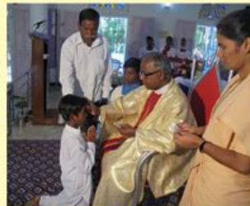
Confirmation : Sikkalnayakkanpet

Bishop's House, Post Box No. 3, Kumbakonam - 612 001.