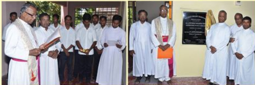
Blessing of the renovated Seminary and Feast Mass : Sacred Heart Minor Seminary, Kum