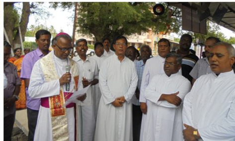
Blessing of the Idayam complex and Mass : Musiri