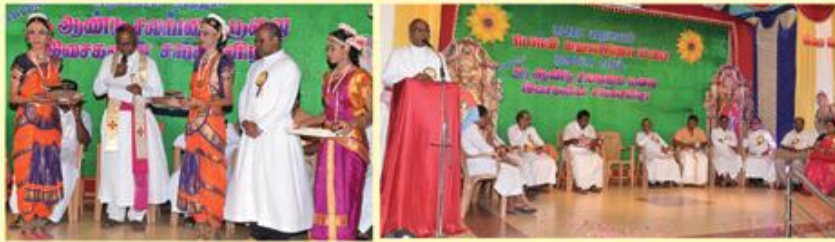
Salangai Poojai : Beschi Communication, Kmu