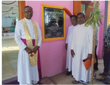
Blessing of the chapel dedicated to St Antony of Paduva : Keelapalur, Malathankulam Parish