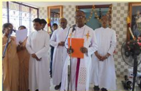
Blessing of the chapel dedicated to Our Lady of Good Health Sikkalnayakkanpet Parish