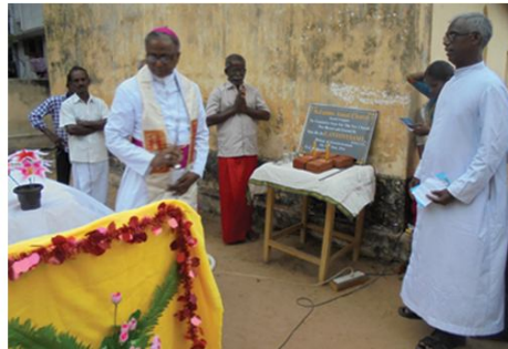
Blessing of the Foundation Stone at Kaniyiruppu