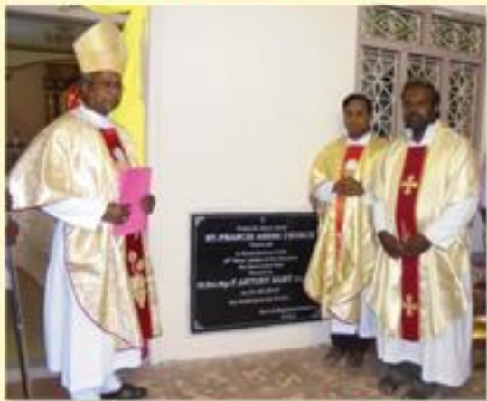
Blessing of the renovated church dedicated to St Francis of Assisi, Padalur