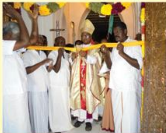
Blessing of the renovated church dedicated to Our Lady of Annunciation, Pudukottai