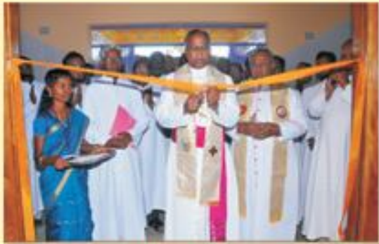
Inauguration & Blessing of the Community Hall & Holy Mass at Irungalur