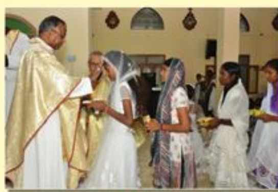
Pastoral Visit : Pullambadi

Bishop's House, Post Box No. 3, Kumbakonam - 612 001.