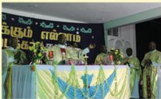
Feast Mass at Elakurichy