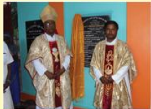
Blessing of the renovated church dedicated to Our Lady of Lourdes at Vadagarai