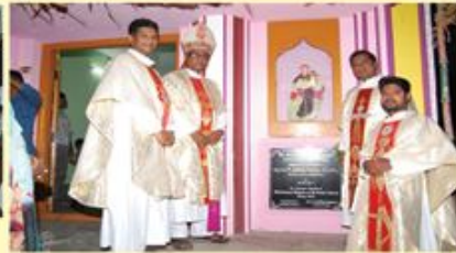
Blessing of the New Chapel Dedicated to St. Antony of Paduva, Malathangulam

Bishop's House, Post Box No. 3, Kumbakonam - 612 001.