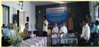
General Body Meeting : Poondi Madha Retreat Cum Worship Centre, Poondi