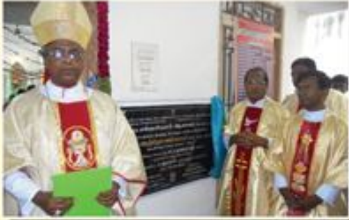
Blessing of the chapel dedicated to St. Francis Xavier; Mettupatti, R. Kattur