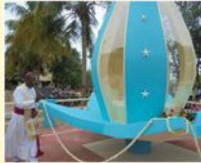
Blessing of the Grotto; Villiavarambal