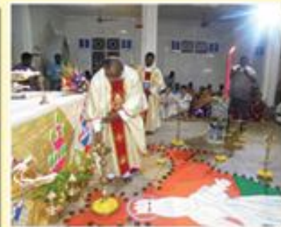
Kuthuvilakku Poojai; Elakurichy