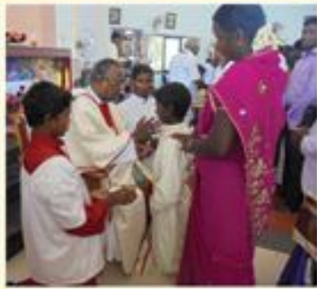
Pastoral Visit; Guanella Nagar