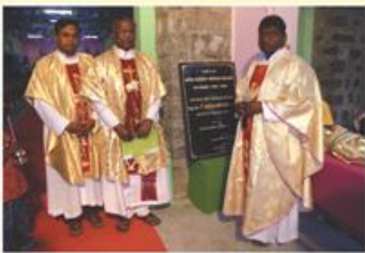
Golden Jubilee of Fathimapuram Parish, Fathimapuram