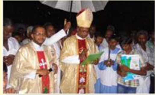
Silver Jubilee of St. Antony's chapel & Blessing of the Bell Tower; Irudayapuram, Kumilanguzhi