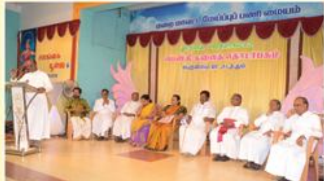
Celebration of Salangai Poojai (Bharadham); Beschi, Communication, Kmu

Bishop's House, Post Box No. 3, Kumbakonam - 612 001.