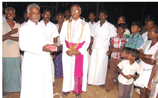
Celebration of Faith : Thirumanur Parish