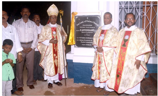
Blessing of the renovated church dedicated to Our Lady of Fatima at Jayankondam