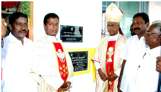
Blessing of the new chapel at Balakrishnampatty : Kottaipalayam.