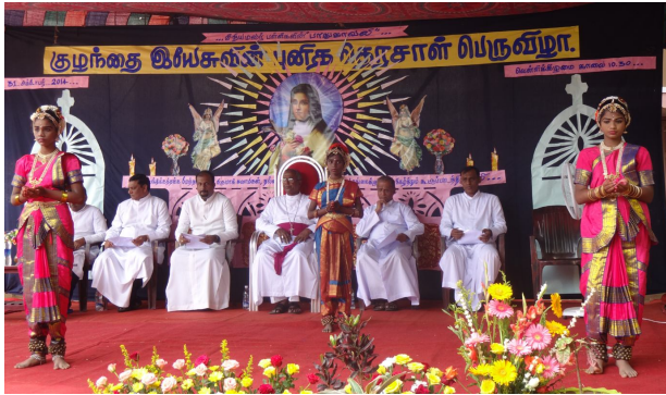
Feast Mass : LFHSS, Kmu